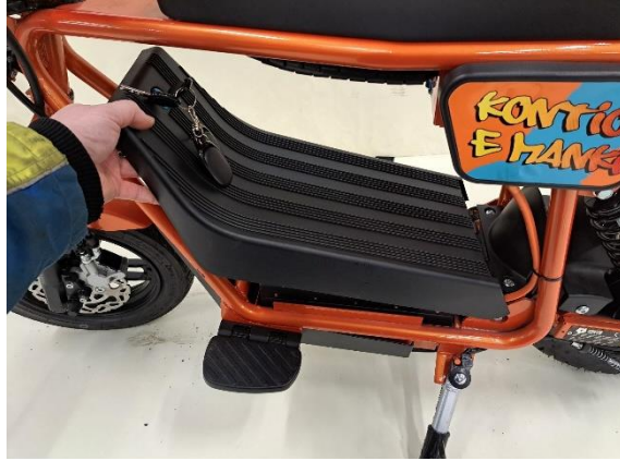
Ota akkukotelon kansi pois.