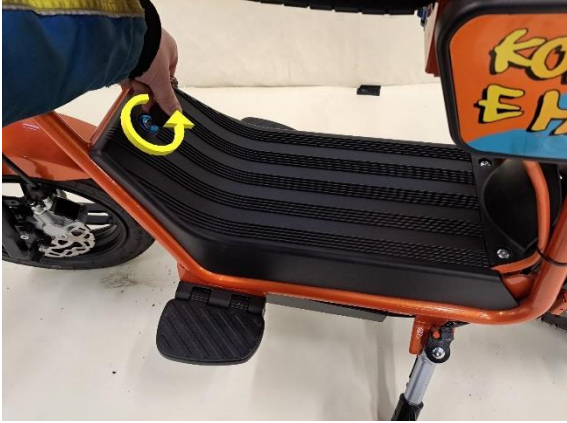
Avaa akkukotelon kannen lukitus.